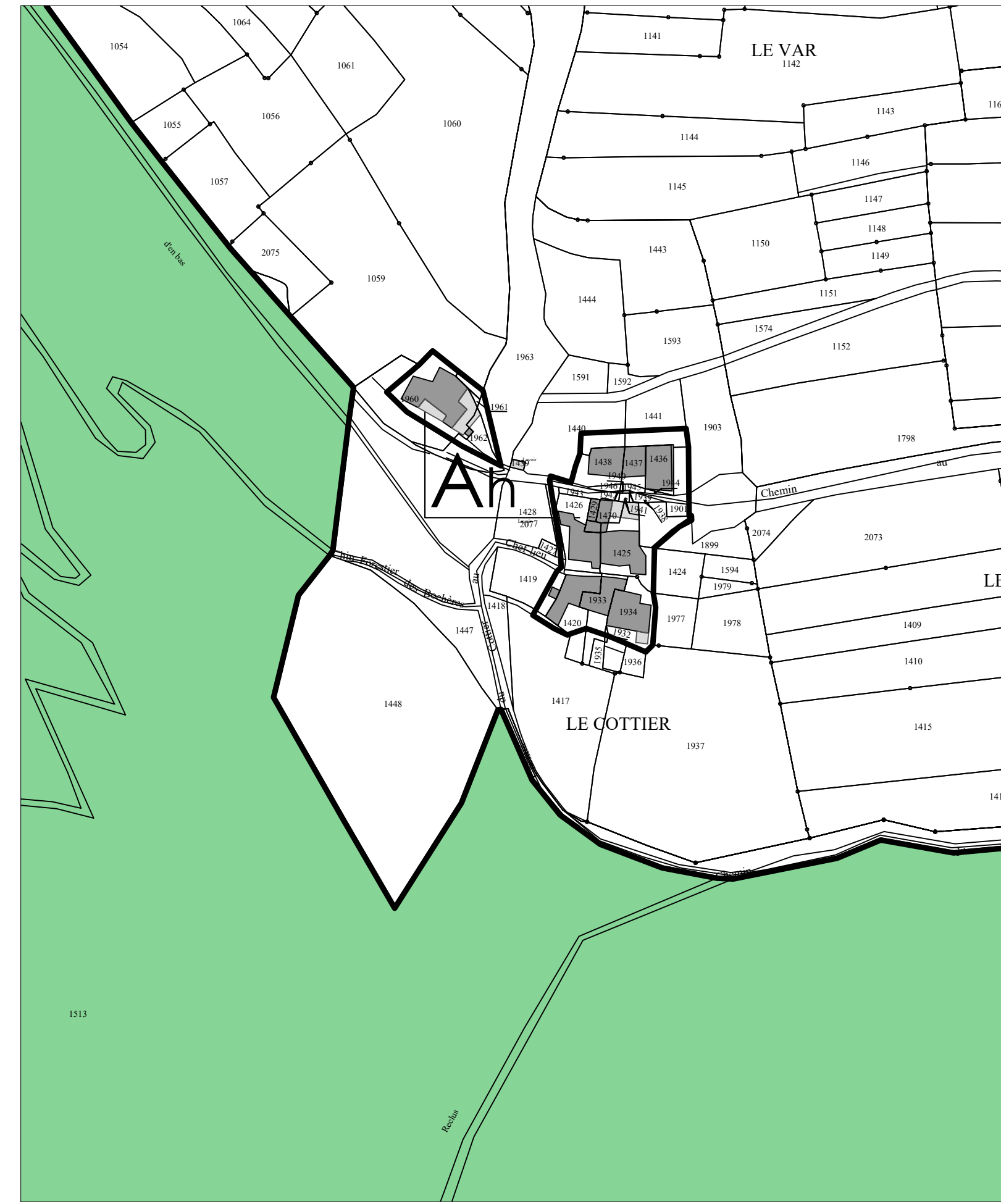
Le Cottier - Echelle 1:1.500°